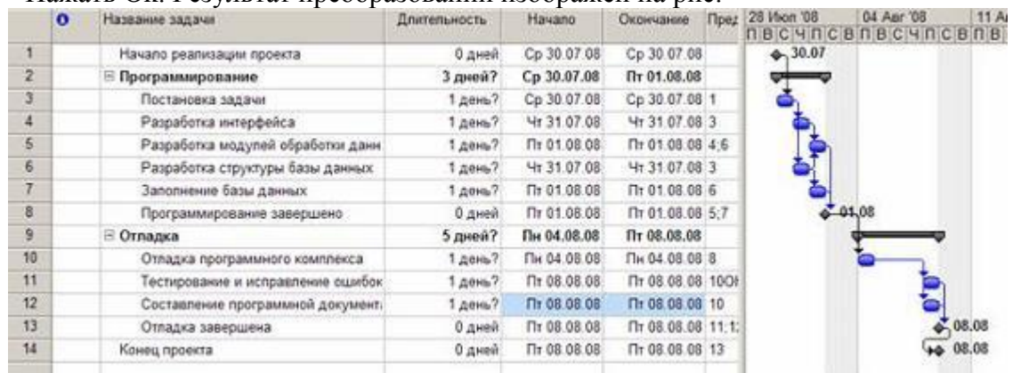
Рис. Результат преобразований